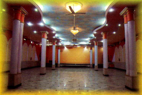
श्रीभागवत कृपा निकुंज स्थित सत्संग भवन