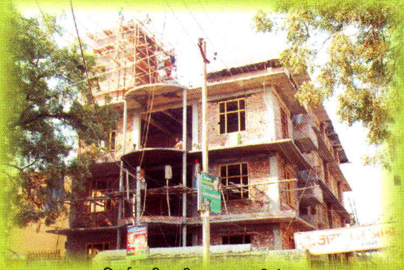
निर्माणाधीन श्रीभागवत आतिथेयम