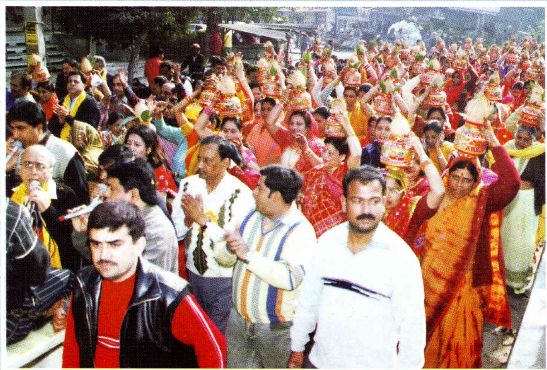
शालीमार बाग, दिल्ली में बीसवें श्रीमद्भागवत कथा आयोजन के अवसर पर कलश यात्रा का दृश्य