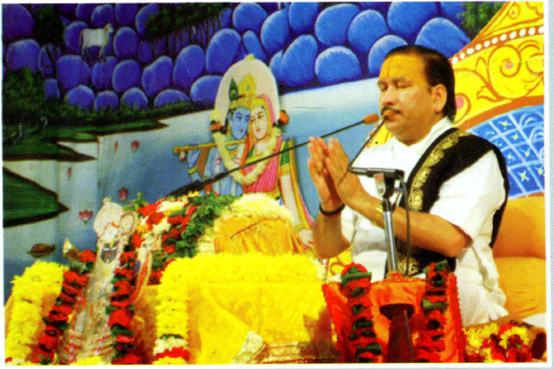
श्रीभागवत कृपा निकुंज स्थित सत्संग भवन में श्रीमद्भागवत कथा प्रवचन करते हुए श्रीठाकुरजी