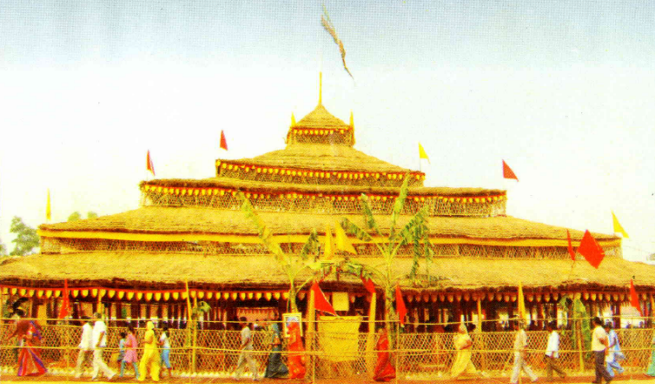
अक्टूबर 2008 में आयोजित हीरा पब्लिक स्कूल, समालखा में श्रीमद्भागवत कथा स्थल पर स्थित यज्ञशाला का दृश्य