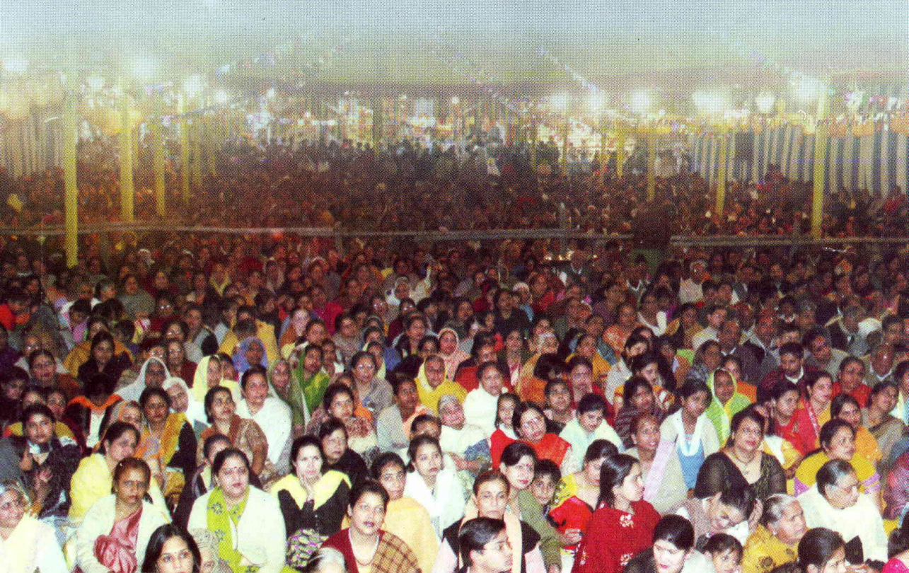
परम पावन जगन्नाथ धाम में आयोजित अष्टोत्तरशत श्रीमद्भागवत कथां यज्ञ के दौरान अपार जन समूह